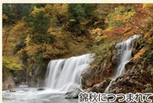
錦秋につつまれて