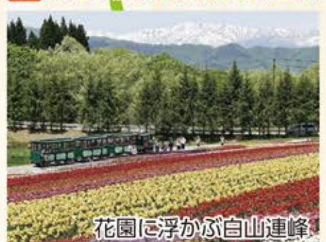
花園に浮かぶ白山連峰

【お問合せ先】 環白山広域観光推進協議会 〒920-8580 石川県金沢市鞍月1-1 石川県観光企画課内 TEL 076-225-1542