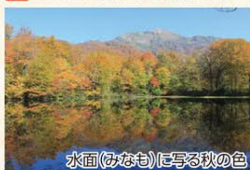
水面(みなも)に写る秋の色