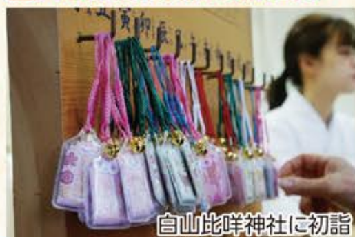
白山比咩神社に初詣